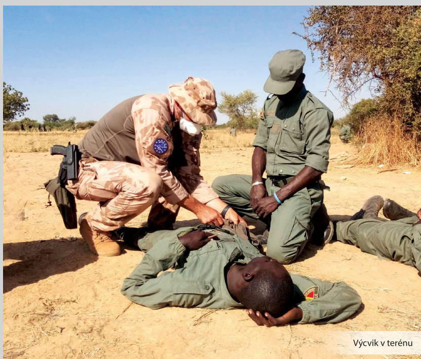
Výcvik v terénu

Předně bych chtěl říci, že něco podobného se týkalo i mne. Také pro mne to byla premiéra v misi. V minulosti jsem působil na zahraničním pracovišti v Bruselu. Takže práce v mezinárodním prostředí pro mne nebyla novinkou.