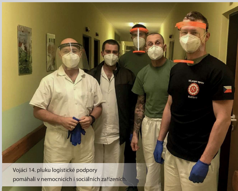
Vojáci 14. pluku logistické podpory pomáhali v nemocnicích i sociálních zařízeních.