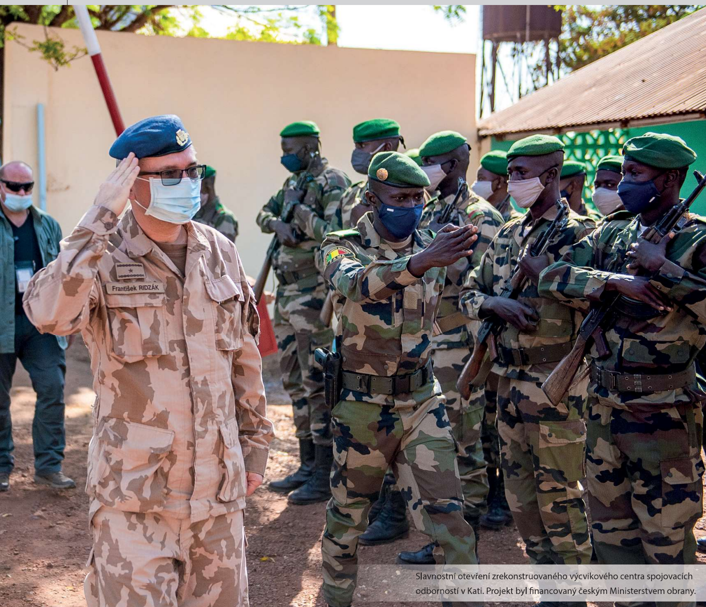
Slavnostní otevření zrekonstruovaného výcvikového centra spojovacích odborností v Kati. Projekt byl financovaný českým Ministerstvem obrany.

a prostředky do nejvyšší pohotovosti. Nepřetržitě jsme monitorovali situaci a byli připraveni reagovat. Nakonec jsem byl rád, že to dopadlo takto. Během celého toho období nejistoty nedošlo k jedinému incidentu vůči mezinárodní komunitě a naší misi. Hned druhý den po převratu šéf spiklenců ve svém prohlášení vyzval mezinárodní společnost a organizace k podpoře prozatímní vlády, která by dovedla zemi k předčasným volbám.