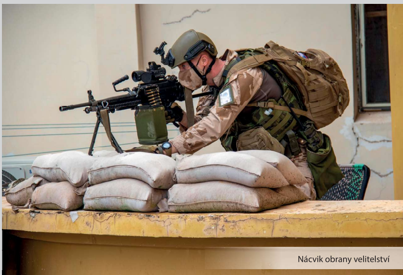
Nácvik obrany velitelství

zjednodušili a zkvalitnili výcvik. Do budování tohoto zařízení se nám podařilo zapojit i místní vesničany z obce Tanabougou a dát jim tak práci. To byl určitý bonus navíc. Tím byla maximálně naplněna idea projektu rychlého dopadu. Osobně jsem se podílel jak na zprovoznění střelnice, tak i výcvikového spojovacího střediska v Katí. Jako náčelníkovi spojovacího vojska mi tato problematika byla