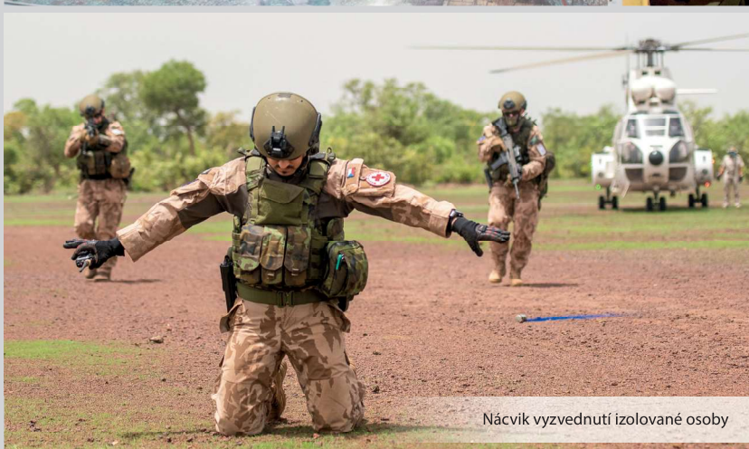
Nácvik vyzvednutí izolované osoby